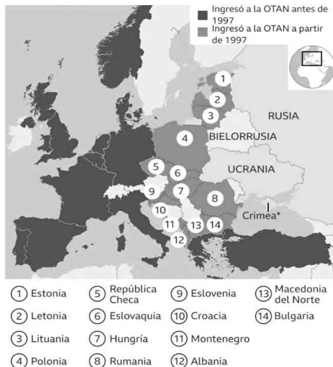
FIGURA 1. Expansión de la OTAN desde 1997

Este tipo de preguntas, se hizo la Federación Rusa cuando se disolvió la URSS y buscaban redefinirse como un nuevo país en un nuevo orden mundial. Ya que, se enfrentaba un periodo de inestabilidad y había perdido una parte de su territorio con la independencia de las ex repúblicas soviéticas.