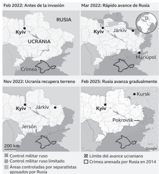
FIGURA 2. Cómo ha cambiado el control militar en Ucrania